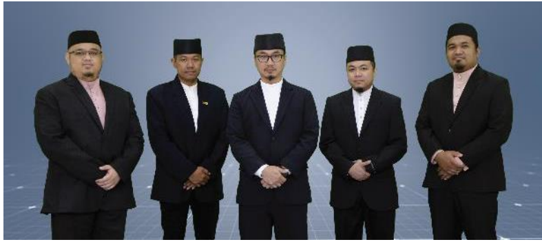
10. “SISTEM PEMANTAUAN KEHADIRAN PELAJAR (SPKP)” Kumpulan “Al-Mubtakirun” | Jabatan Pengajian Islam